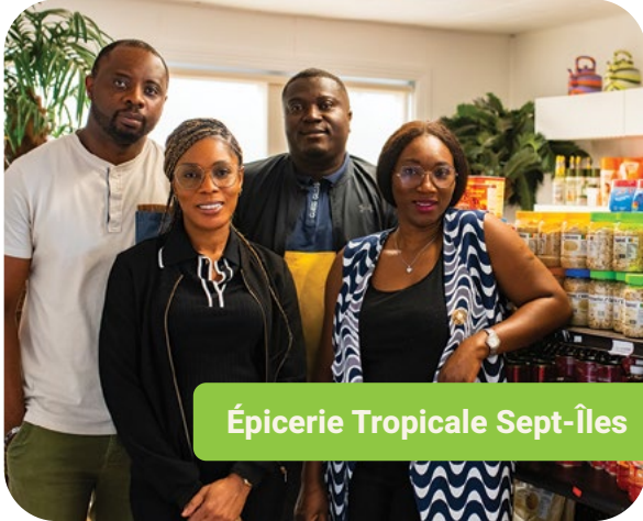
Épicerie Tropicale Sept-Îles

L'Épicerie Tropicale, c'est l'histoire de deux couples originaires de la Côte d'Ivoire qui ont jeté l'ancre à Sept-Îles. En constatant l'absence de produits alimentaires typiques de leur région natale dans les commerces locaux, les quatre amis-es ont décidé d'ouvrir une épicerie proposant des produits typiques provenant de partout dans le monde. Leur objectif : permettre aux nouveaux arrivants-es d'accéder aux goûts et aux odeurs de leur enfance tout en faisant découvrir de nouvelles saveurs à la communauté nord-côtière.