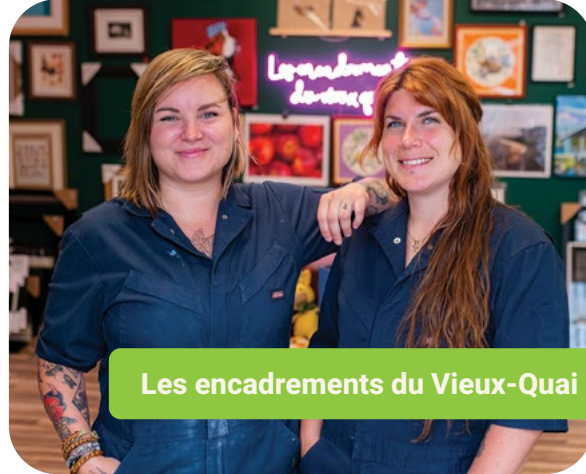
Les encadrements du Vieux-Quai

Les Encadrements du Vieux Quai a vu le jour en 1975. Près de 50 ans plus tard, deux jeunes Septiliennes reprennent le flambeau et se lancent dans leur première aventure entrepreneuriale. Elles poursuivent la fabrication d'encadrements sur mesure, tout en offrant un vaste choix de matériel pour artistes et une vitrine de la création locale. Elles proposent également des ateliers d'art, avec pour objectif de créer une communauté artistique à Sept-Îles.